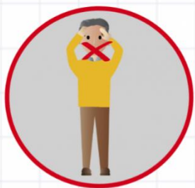
РАК ГУБЫ, ЯЗЫКА